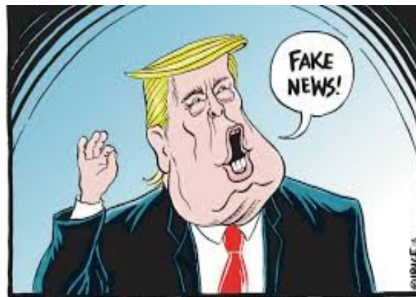
TRUMP REACTS TO DEMOCRAT'S WIN OF THE HOUSE OF REPRESENTATIVES